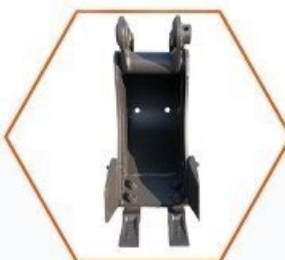
Podkopová lžíce 200mm