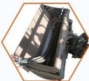
Svahová lžíce 1000mm hydraulická