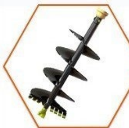
Půdní vrták 300mm