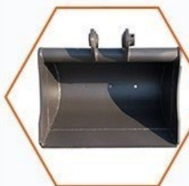
Svahová lžíce 500mm