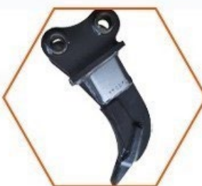
Rozrývací trn velký