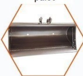
Svahová lžíce 1000mm